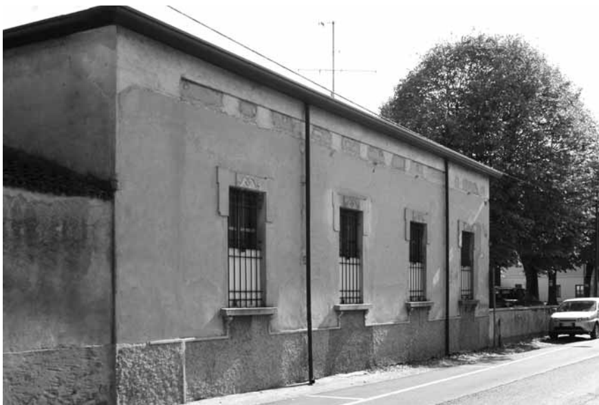
L'esterno della Scuola di lavoro