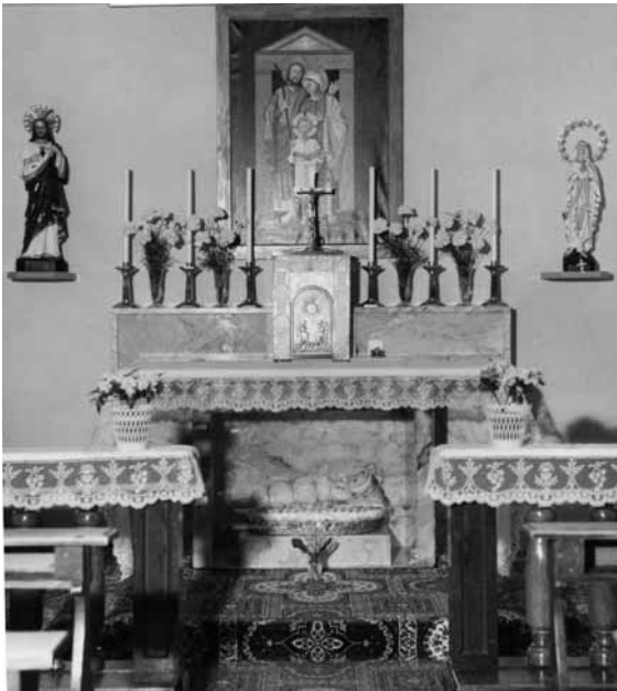
La Cappella negli anni '50

anche per assicurare ai neonati la prima assistenza; ospitavano temporaneamente qualche bambino orfano o di famiglie particolarmente disagiate.