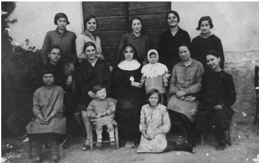
La Scuola di lavoro, anni '20