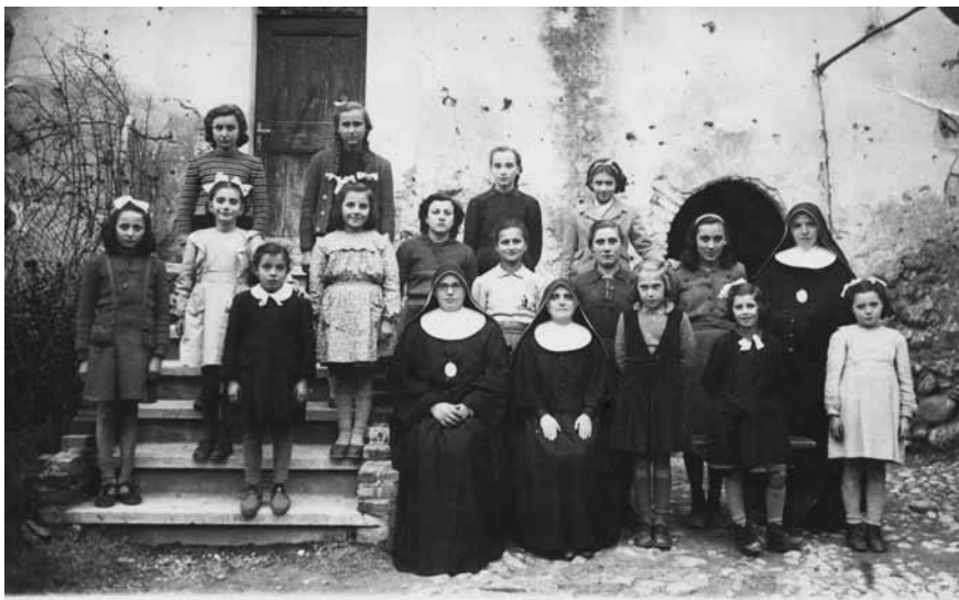
Suore e allieve della Scuola di lavoro, anni '40